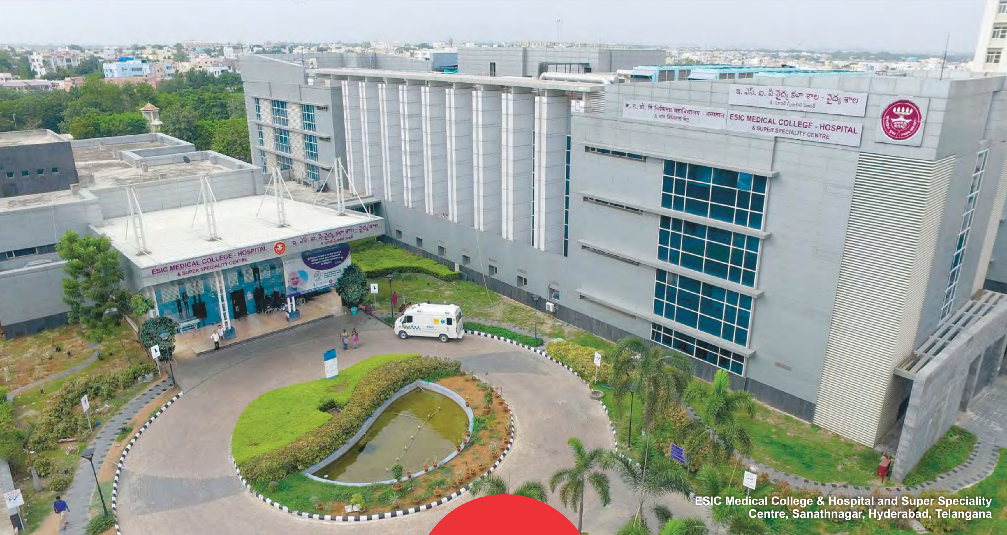
ESIC Medical College & Hospital and Super Speciality Centre, Sanathnagar, Hyderabad, Telangana